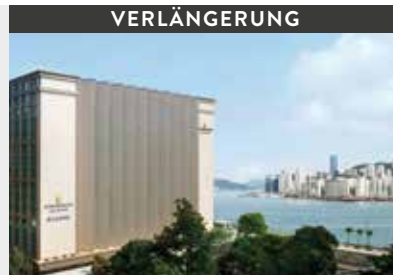
Hongkong | InterContinental Grand Stanford Hong Kong (5*) Premier Room | Beste Lage und atemberaubende Aussichten