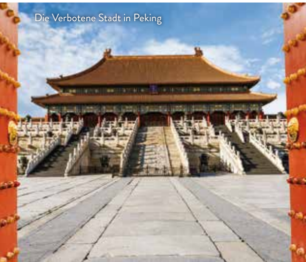
Die Verbotene Stadt in Peking