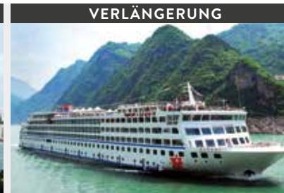
Jangtse | Century Legend (Schiff) Deluxe Cabin | Kreuzfahrt durch die berühmten „Drei Schluchten“