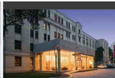
Xi'an | Grand Mercure Xian on Renmin Square (4*) Superior Room | Modernes Stadthotel