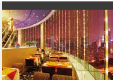
Shanghai | Jin Jiang Hotel Shanghai (5*) Garden View Room | Traditionshotel in der Französischen Konzession