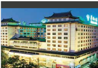
Peking | Prime Hotel Beijing (5*) Superior Room | In der Mitte der Metropole, beste Lage für den Citytrip