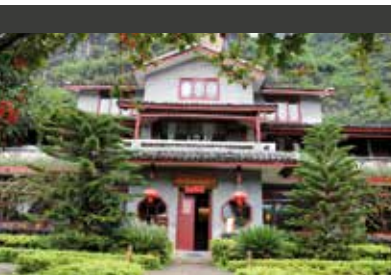
Yangshuo | Yangshuo Mountain Retreat (4*) River View Room | Landestypisches Hotel direkt am Li-Fluss

7. TAG LUOYANG – XI'AN | Ausflug zu den Longmen-Grotten. Das Besondere an diesem UNESCO-Weltkulturerbe: In diesem einmaligen Ensemble aus künstlichen Höhlen finden sich unzählige Pagoden, Gedenksteine, Buddhafiguren und Steinskulpturen. Anschließend erfolgt der Transfer zum Bahnhof und Fahrt mit dem Schnellzug nach Xi'an (Fahrdauer ca. 3,5 Std.), wo Sie am späten Nachmittag ankommen. Im Restaurant Defangchang serviert man Ihnen Jiaozi,