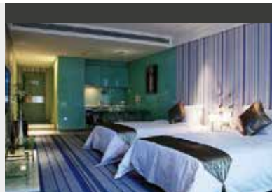
Luoyang | Christian's Hotel (4*) Themed Room | Moderne und verspielte Thematik mit allem Komfort